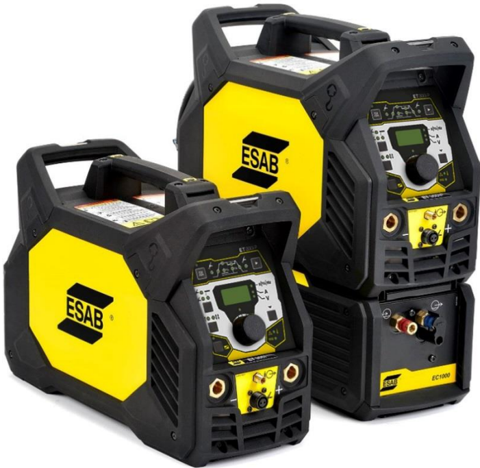
RENEGADE ET 300iP

Renegade ET 300 iP es un equipo inverter para Electrodo y TIG de alta frecuencia (HF) con una excelente relación Potencia-Peso. Su diseño compacto facilita su transporte a cualquier área de trabajo. Combinado al elevado ciclo de trabajo, la capacidad de funcionar correctamente con largos cables de alimentación y de soldadura lo vuelven un equipo superior e inigualable tanto dentro como fuera del taller.